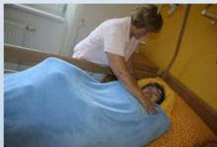
Polohovanie - hniezdo