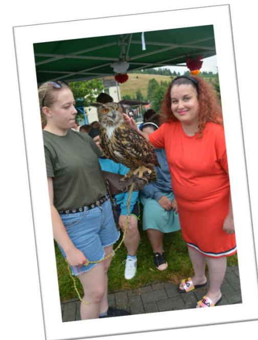
Bol pripravený pekný program 😊