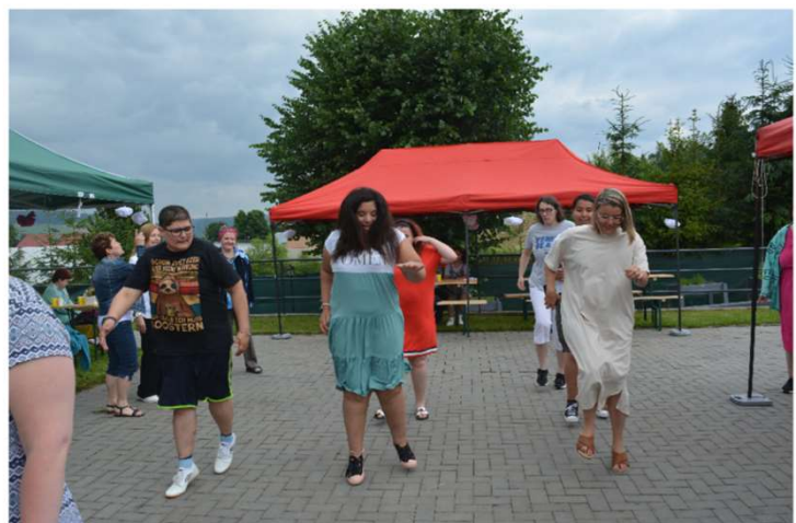
Naše obyvateľky si stretnutie užili a super za zabávali 😊