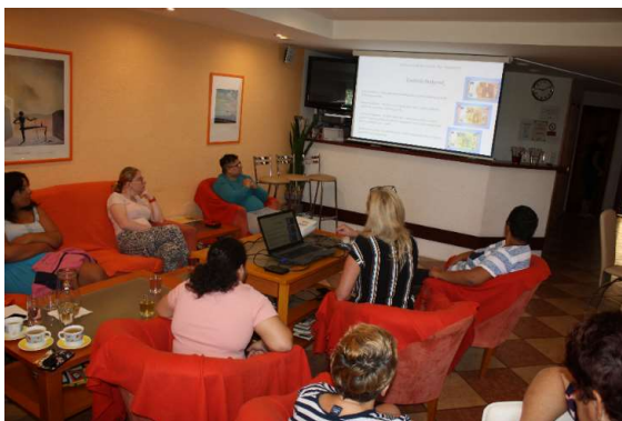
Prezentácia – Hodnota peňazí a finančná gramotnosť