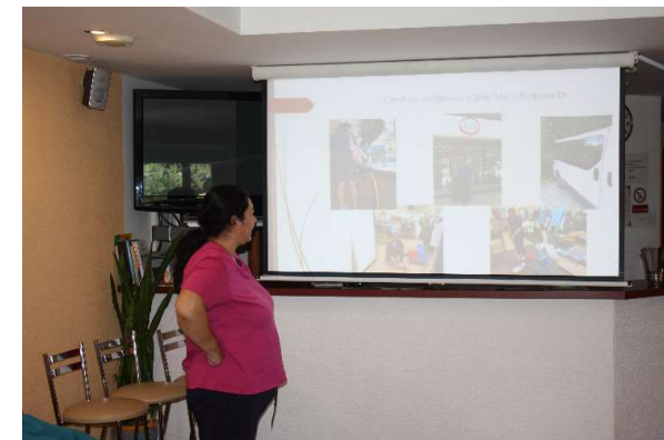
Prezentácia – Forma aktivizácie PSS na voľnom trhu práce