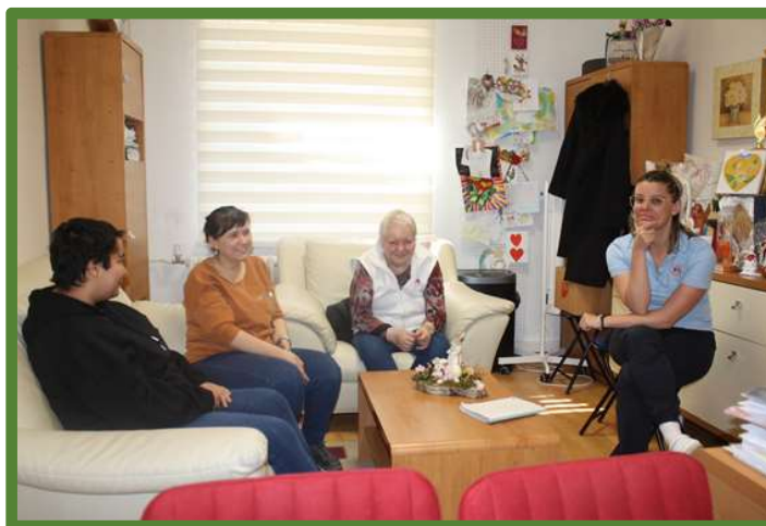
Podpora samostatného bývania s kľúčovou pracovníčkou