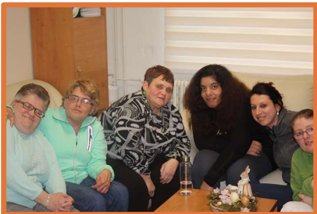
Podpora samostatného bývania