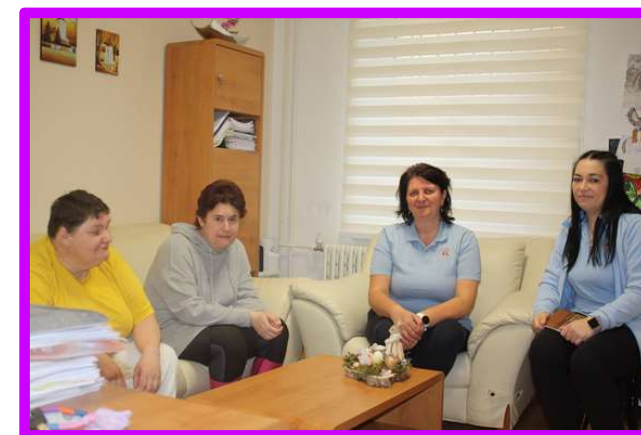
Samostatný byt č. 3 s kľúčovou pracovníčkou a vedúcou URZ