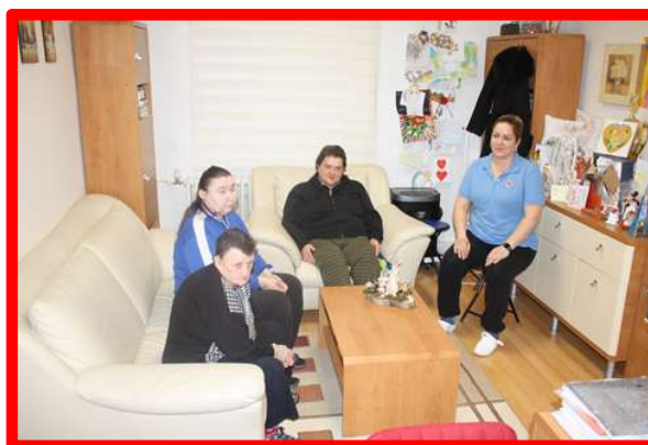
Samostatný byt č. 2 s kľúčovou pracovníčkou