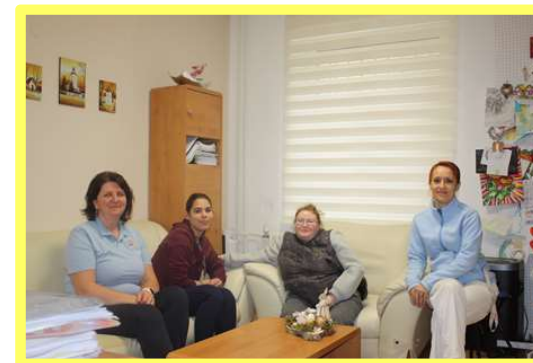
Samostatný byt č. 1 s kľúčovou pracovníčkou a vedúcou URZ