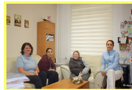
Samostatný byt č. 1 s kľúčovou pracovníčkou a vedúcou URPZ