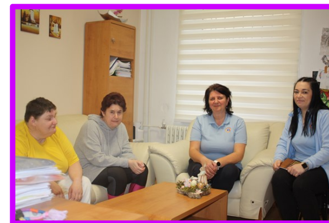
Samostatný byt č. 3 s kľúčovou pracovníčkou a vedúcou URPZ