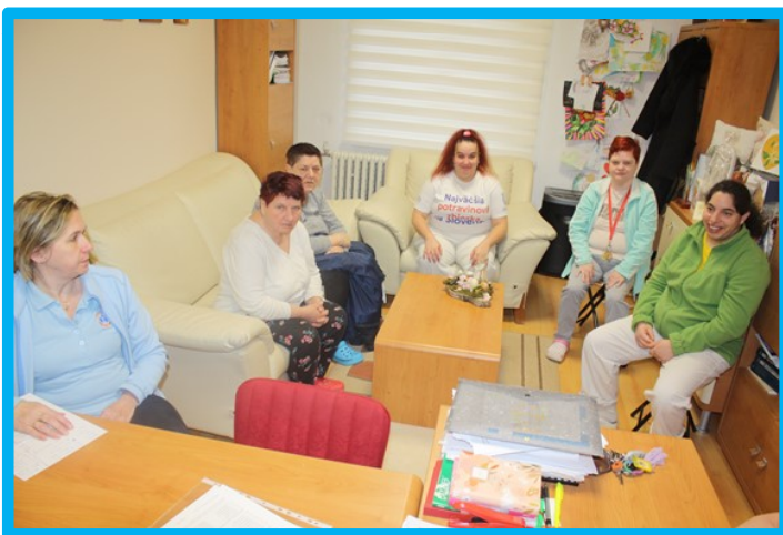
Zariadenie podporovaného bývania s kľúčovou pracovníčkou