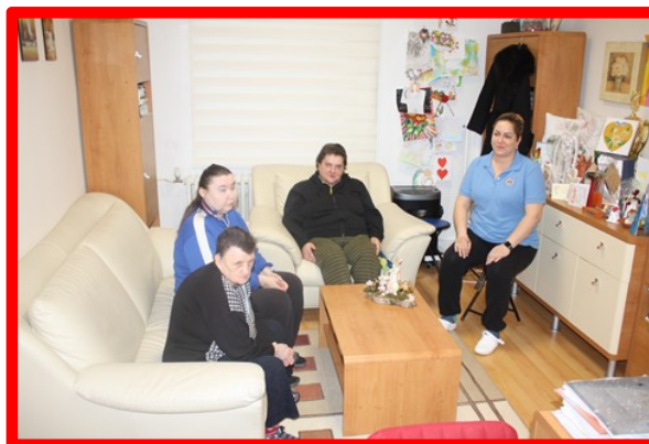
Samostatný byt č. 2 s kľúčovou pracovníčkou