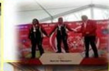
Bežecké lyžovanie na 100m Romunka – zlato, Deniska – striebro.