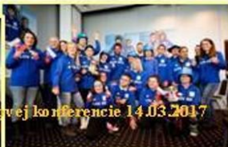
z tlačovej konferencie 14.03.2017