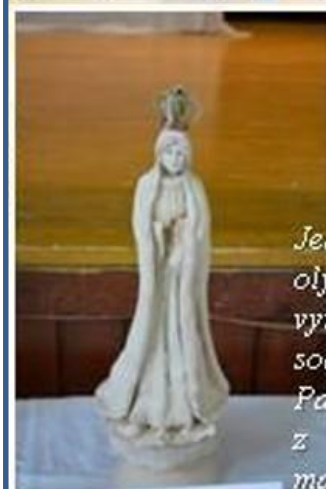
Jednou z častí olympiády bolo vytvorenie sochy Panny Márie z ľubovlného materiálu.