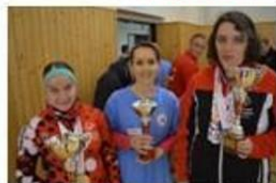
Poháre a torta pre víťazný tím

Krajského turnaja v bocci, ktorý sa konal v telocvični ZŠ v obci Turie 5.4.2017