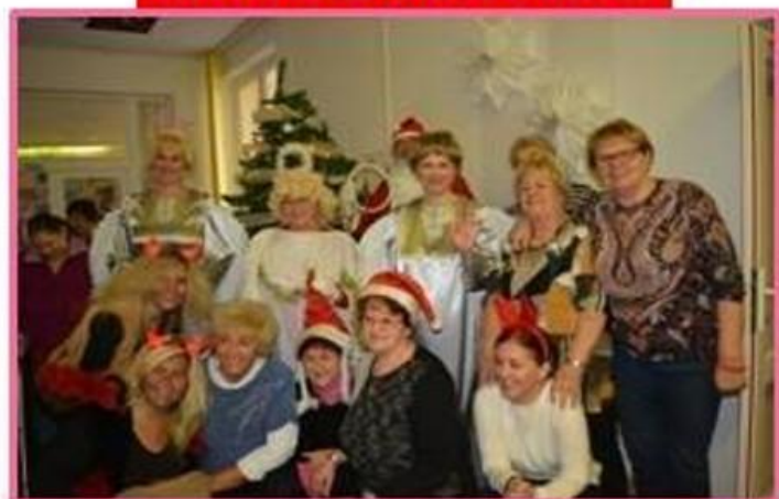
Dobrovoľníci zo senior klubu Priateľka...