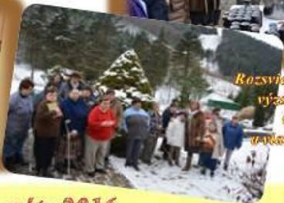
Rozsvietenie vianočnej výzdoby v areáli CSS TAU a vianočný punč...