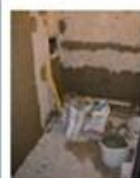
Rekonštrukcia kúpeľne v 1. samostatnom byte...