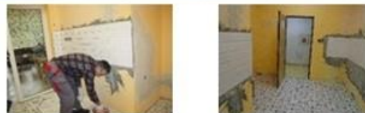
Rekonštrukcia kuchynky pre ÚRPZ v časti A na 1. nadzemnom podlaží...