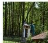
Výstavba externej kaplnky v areáli nášho zariadenia...