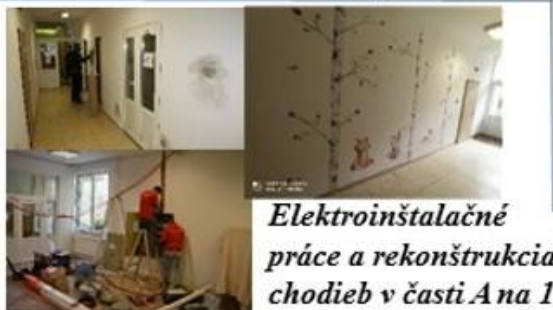
Elektroinštalačné práce a rekonštrukcia chodieb v časti A na 1. nadzemnom podlaží....