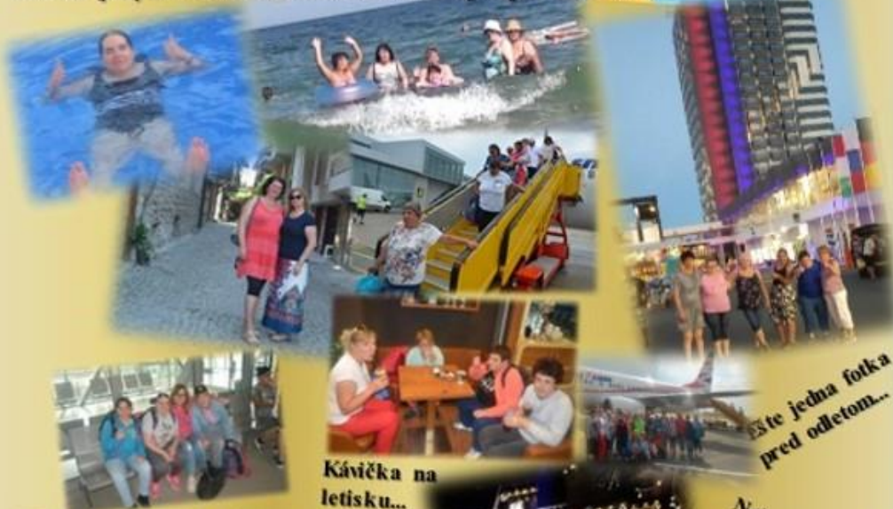
Esťe jedna fotka pred odletom...