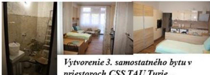
Vytvorenie 3. samostatného bytu v priestoroch CSS TAU Turie...