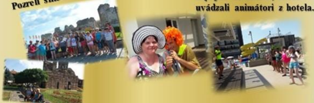
Naše dievčatá sa radi zapájali do aktivít, ktoré uvádzali animátori z hotela...

12. septembra sme pre naše prijímateľky pripravili prezentáciu o dodržiavaní ľudských práv osôb so zdravotným hendikepom.