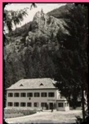
Chata Slobody Turie