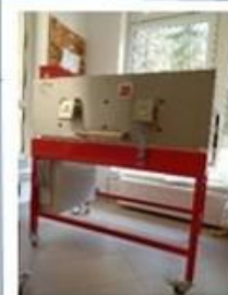
Sklárská pec na spekanie skla zakúpená z dotácii...