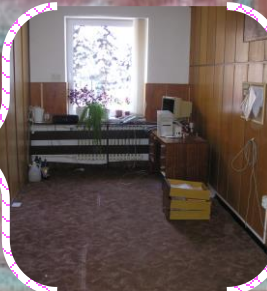
Úprava kancelárií, výmena podlahy