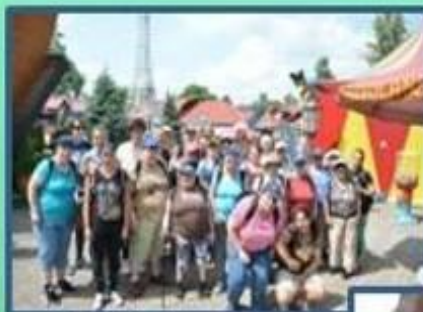
Rabkoland, 27.7.2016 Poľsko