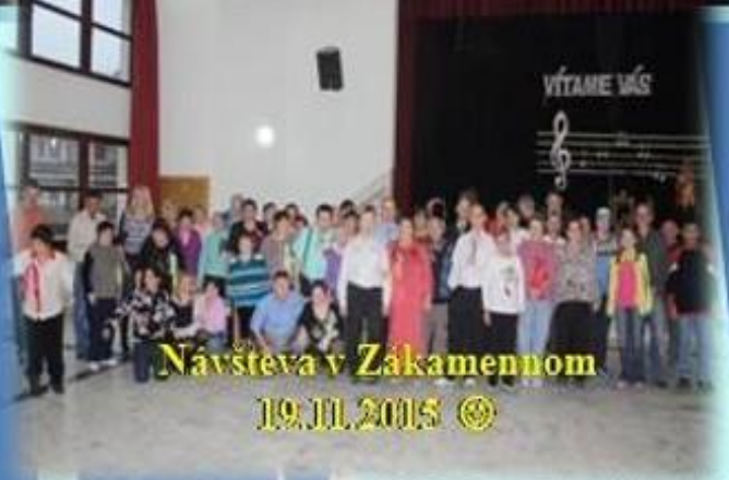
Návšteva v Zákamennom 19. JIL. 2015 ☺