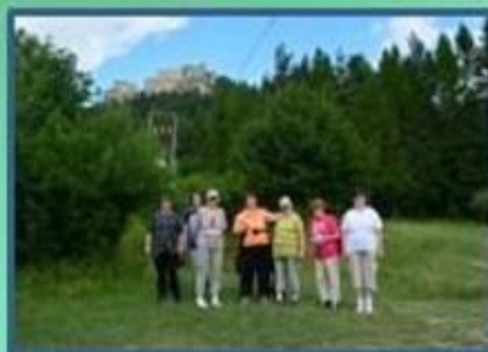
Na Lietavskom hrade, 6.7.2016