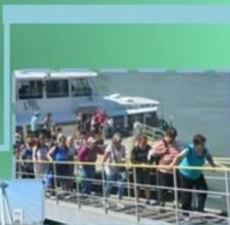
Bratislava – Devín výlet loďou 24.8.2016