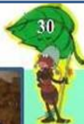
Rajecká Lesná, 23.09.2015