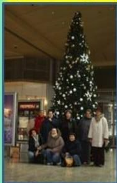
Žitina a vianočná atmosféra