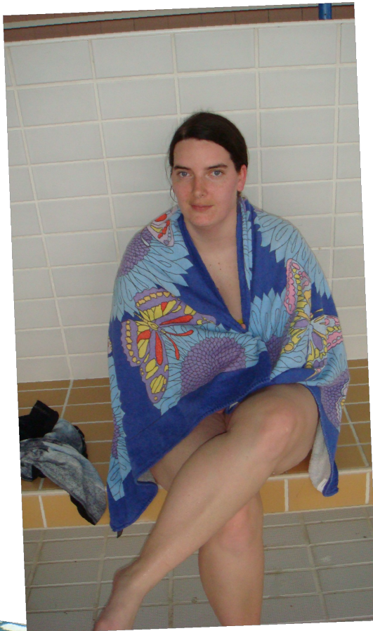
Radost' z vody bola obrovská.