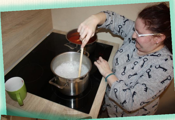
Ivetka sa naučila obsluhovať novú elektrickú rúru