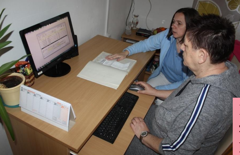
Majka sa zdokonalila v programe ALFA