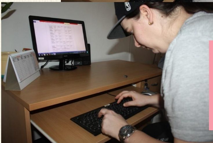
Barborka s Angelikou sa zorientovali v základoch práce s PC.