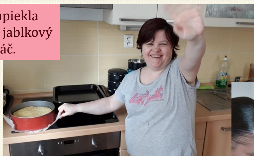
Milka upiekla chutný jablkový dia-koláč.